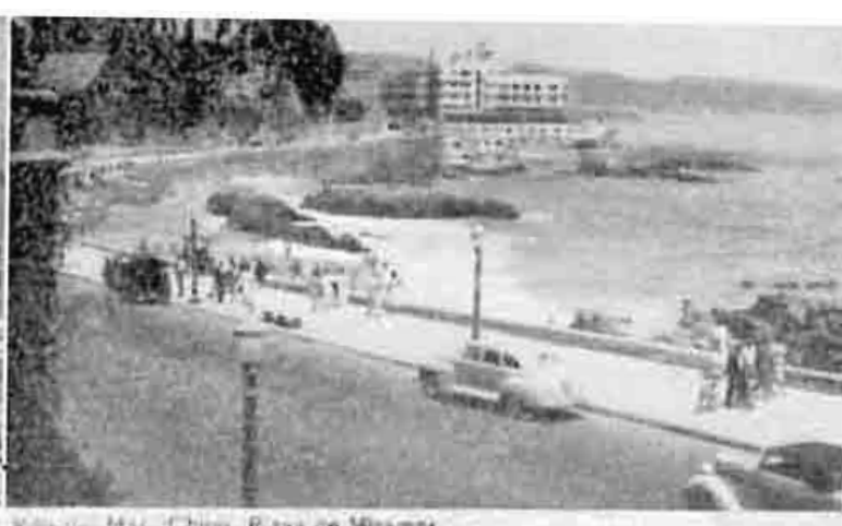
Bild 8. Badorten Viña del Mar, strax norr om Valparaíso.

månaderna oktober—november är naturen dock såväl här som nere i staden grönskande och underbart vacker.