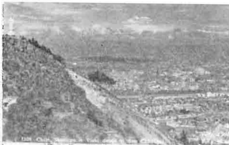
Bild 7. Santiago de Chile. Utsikt från San Cristóbal.