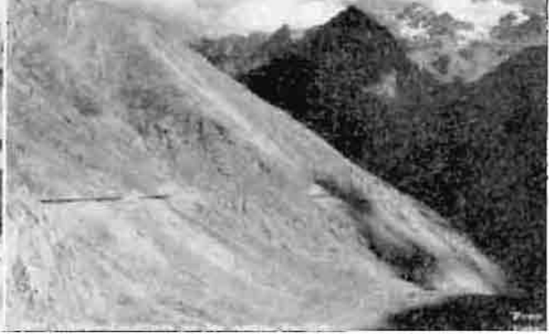
Bild 6. Utför Anderna, vid Portillo i Chile.

himlen. Vi rullade nu ner emot en uttorkad flodfåra, »Rio Desaguadero», varom skall nämnas mera senare, och gingo sedan genom ett bälte av milsvädd, tät buskskog av dystert utseende.