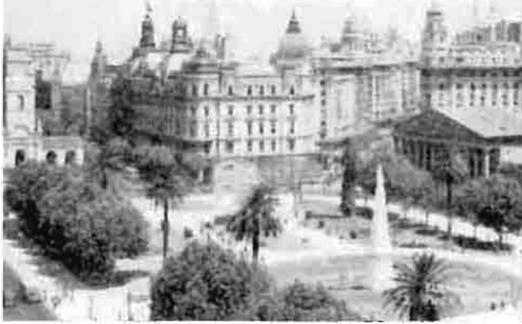
Bild 5. Plaza de Mayo i Buenos Aires.