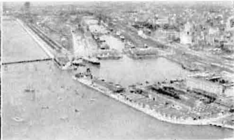
Bild 3. Rio de Janeiro. Flygvy från Corcovado.