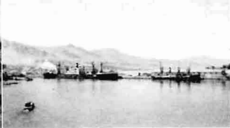
Bild 10. Hamnen i Antofagasta.

Som ett bevis på folkets patriotiska känslor hade man högt uppe på en klippvägg å bergsslutningen ovanför staden med c:a 5 m. höga bokstäver skrivit: »Gloria a O'Higgins» och därunder avbildat den chilenska flaggan. O'Higgins var en av General San Martíns medhjälpare, som fullbordade landets befrielse från spanska väldet år 1818.