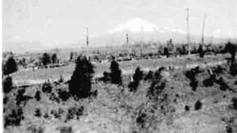
Bild 9. Rester av bränd skog. Vulkanen Villarrica.